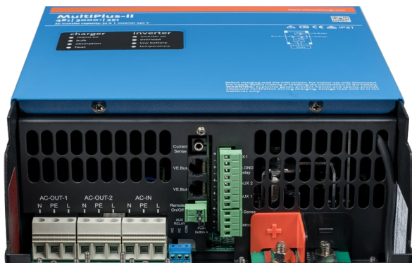
Área de conexión